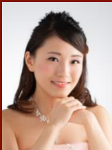
ソプラノ 廣澤 ひとみ Hitomi HIROSAWA