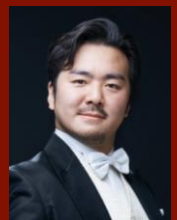
バリトン 又吉 秀樹 Hideki MATAYOSHI