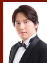
バリトン 岡田 頼祈 Raiki OKADA